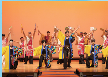
知的障がい児・者のダンスチーム マーチ&ばんびーの