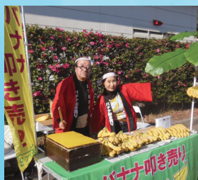
「バナナのたたき売り」 by 全言連