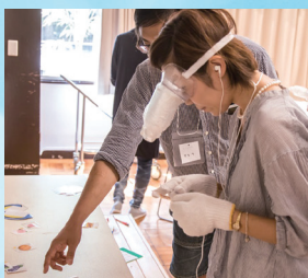
「自閉症体験」 by ADDS