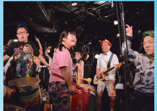
究極のバリアフリーロックバンド サルサガムテープ