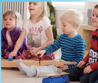
「ブンネ楽器」 by プンネ・ジャパン