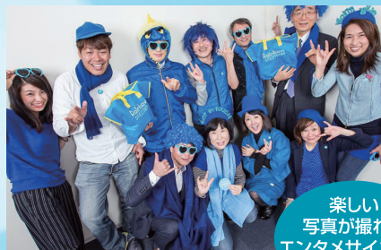
「Blue Photo Spot」 by Get in touch